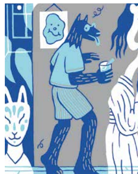
PARADE FANTASTIQUE © Lucille Meister

Sur les quais, dans des bars, des boutiques, des ateliers, ou des salles d'exposition... l'illustration se propage sur tous les fronts !