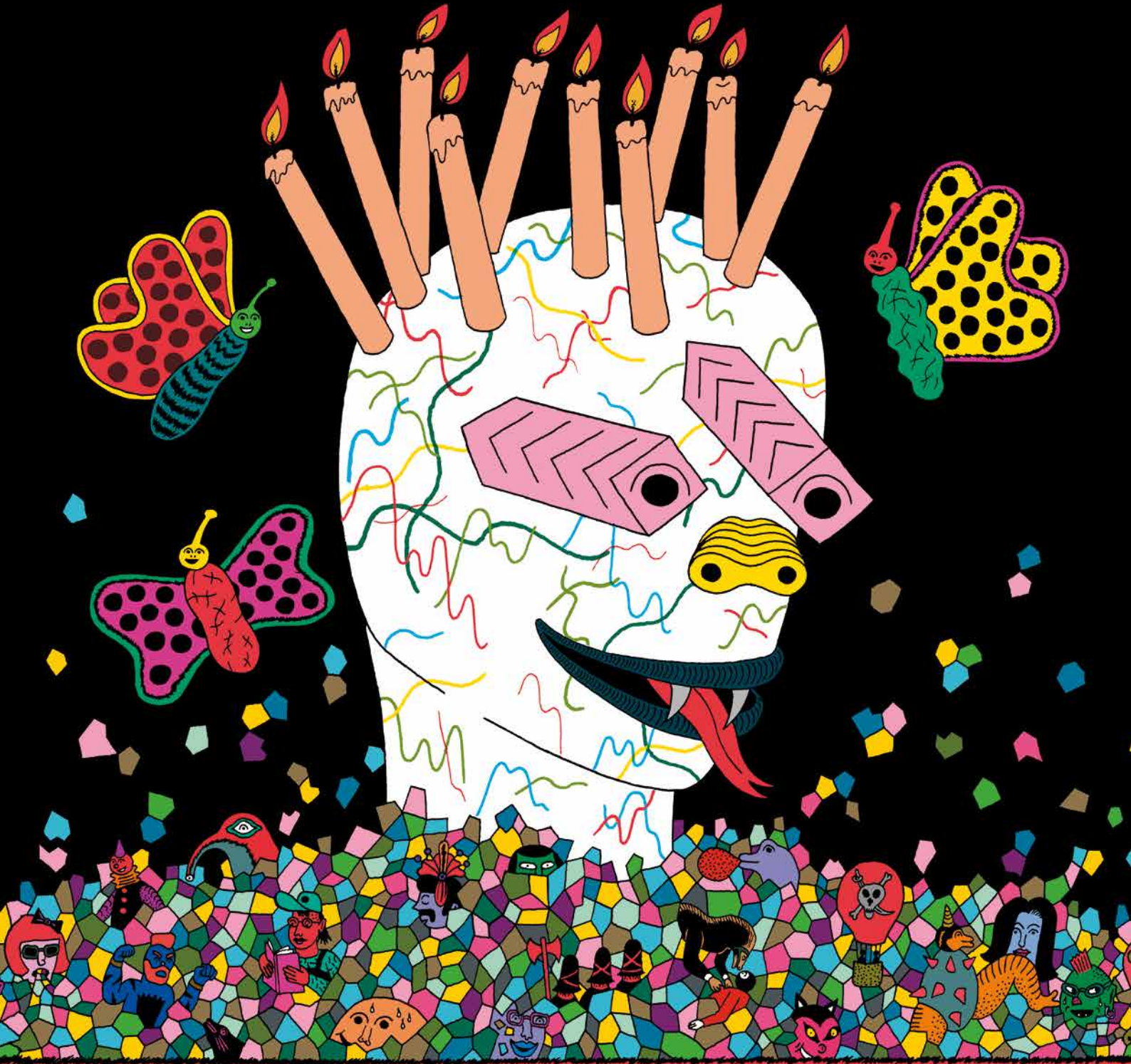
ILLUSTRATION + BANDE DESSINÉE + DESSIN