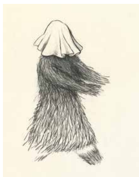
DIALOGUE DE DESSINS © Frédérique Bertrand + © Manon Debaye

Chaque éditeur ou collectif présent fait don de l'une de ses éditions pour constituer un panier garni dont il faudra deviner le poids. Faites vos paris à l'accueil du Salon !