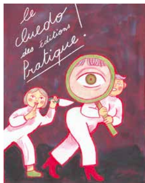
CLUEDO © Lisa Blumen