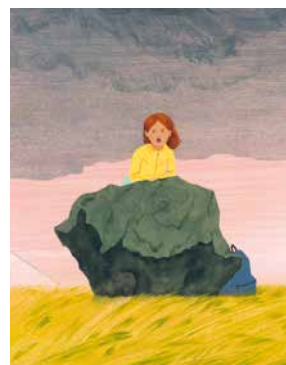
PARCOURS D'AFFICHES © Marion Duval